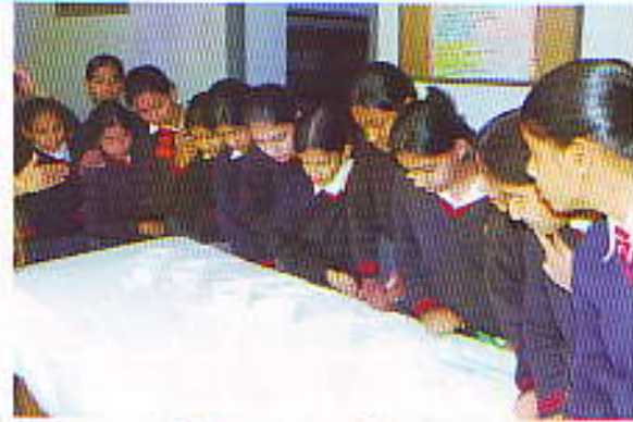
मच्छर की विभिन्न अवस्थाएँ देखती हुई छात्राएँ