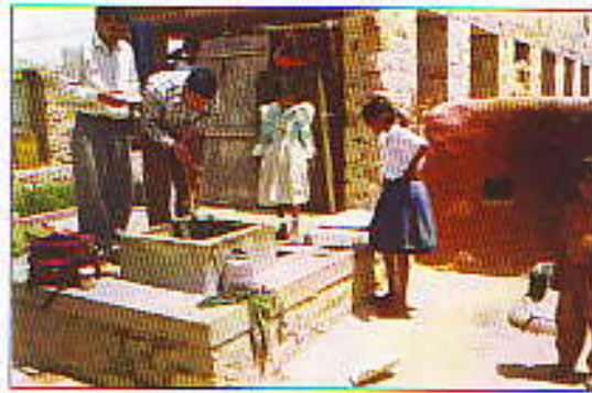
चित्र 1: एनाफिलीज़ स्टीफेंसी का विभिन्न ऋतुओं में प्रजनन क्षेत्र