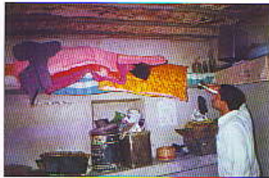
चित्र 3: एनाॅफिलीज स्टीफेंसी के विभिन्न ऋतुओं में विश्राम स्थल